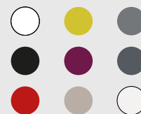
9 διαθέσιμα χρώματα