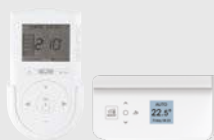
Ψηφιακά χειριστήρια LCD